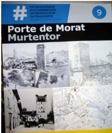
Tafel beim Murtentor

angestossen und verstärkt sicht- und erlebbar gemacht werden. Daher das Motto des Kulturerbejahres: Schau hin!