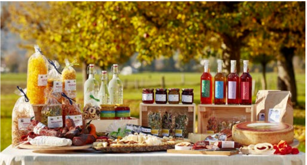
Der Naturpark Gantrisch wirbt nicht nur mit seiner atemberaubenden Landschaft, sondern auch mit Spezialitäten und Nahrungsmitteln aus der Region.