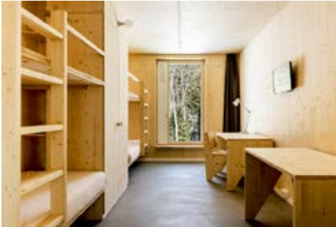
Ein Schlafzimmer für Zivis, konsequent mit Holz ausgestattet.

kaserne einzog, kann man als Ironie des Schicksals betrachten.