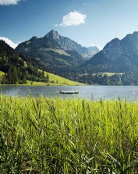
Der regionale Naturpark Gantrisch reicht bis an den Schwarzsee.

im Sense- und Schwarzwassergebiet. Innert kürzester Zeit erreicht man endlose Wälder, ursprüngliche Wiesen und tiefe Canyons. Hier lassen sich wilde Tiere beobachten, Mutproben bestehen, regionale Spezialitäten verkosten und atemberaubende Aussichten genießen. Am besten entdeckt man das Gebiet auf Wanderungen und Velotouren, bspw. auf dem Panoramaweg, dem Gürbetaler Höhenweg, dem Naturerlebnispfad Grasburg, in der Urlandschaft Brecca oder der beeindruckenden Schwarzwasserschluft.